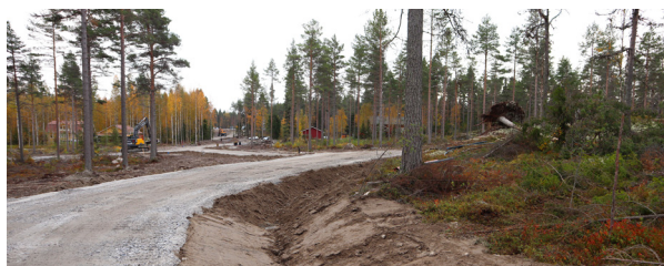
Björnvikintien alueelta löytyy hienoja korkeita metsätontteja.

Bosundista löytyy myös vapaita tontteja Murmästar-alueelta. Lisäksi Sandgrundetilla on kunnan omistama rantatontti, joka pian tulee myyntiin. Pitäkää silmät auki, lisätietoja julkaistaan myöhemmin syksyn aikana.