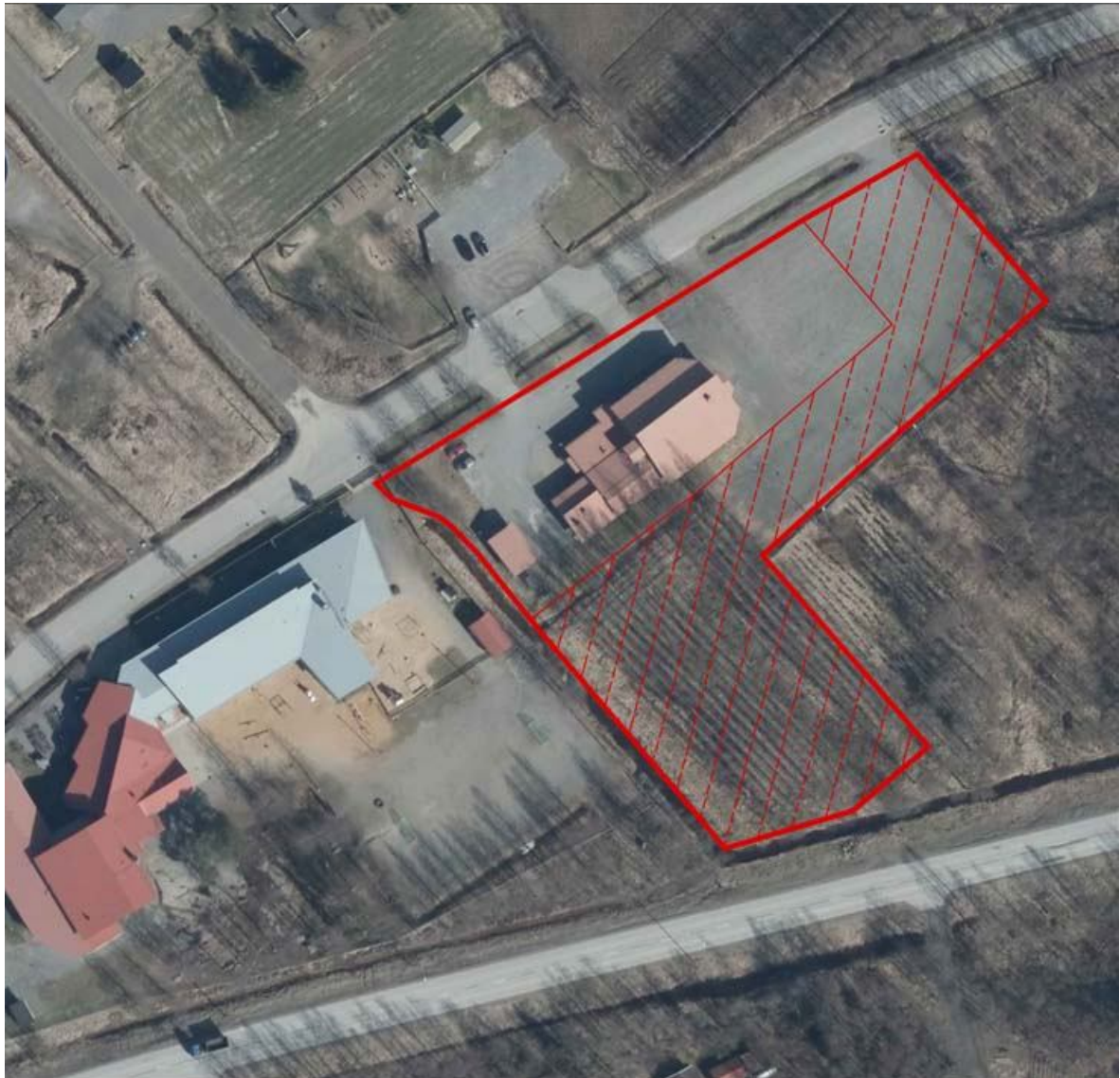
Bild 1. Planeringsområde. Detaljplanetvidgningen markerad med röd skraffering. Kuva 1. Suunnittelualue. Asemakaavan laajennusalue varjostettu punaisella katkoviivalla.