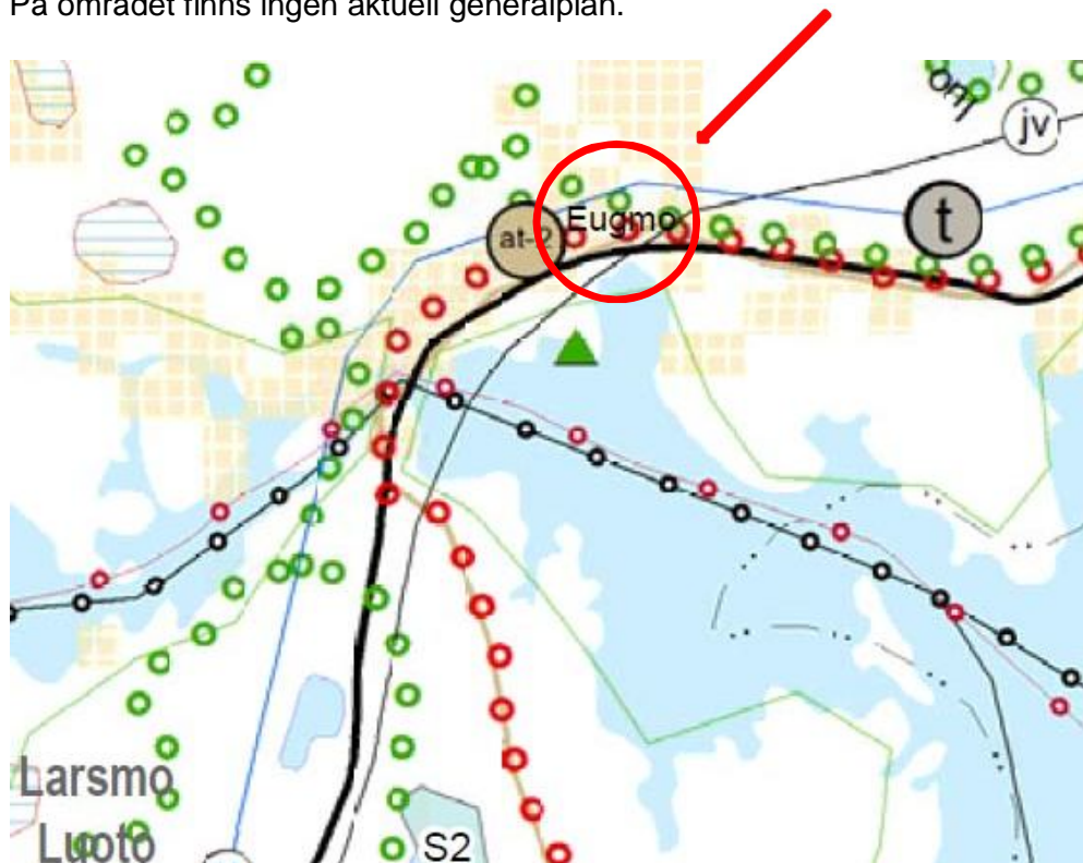
Bild 2. Del ur Österbottens landskapsplan 2030.

På området finns ingen aktuell generalplan.