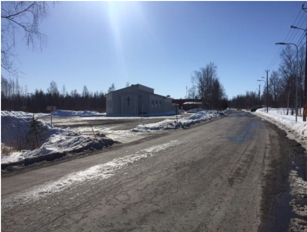
Bild 2. Detaljplaneområdet sett från nordost längs Näsvägen.