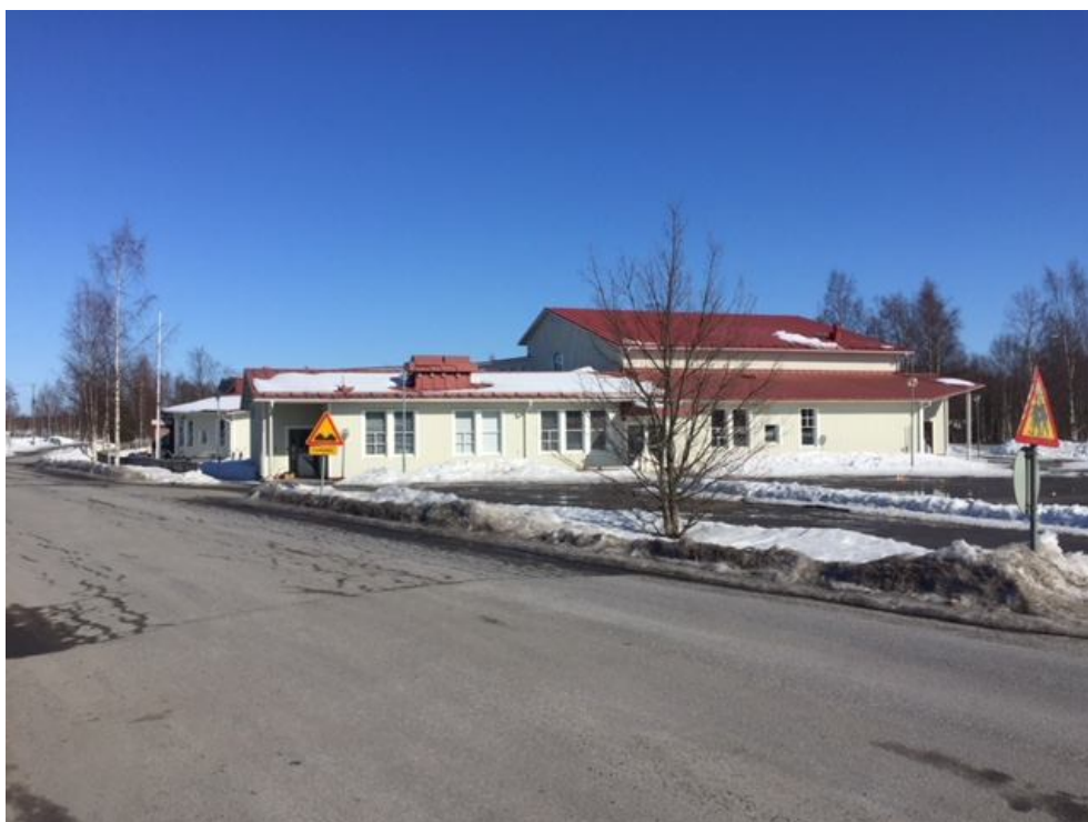
Bild 5. Näs skola.