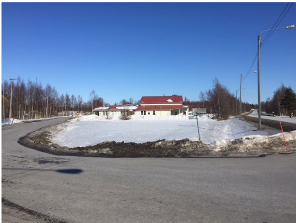
Bild 1. Detaljplaneområdet sett från sydväst.

Största delen av planeområdet är bebyggt. På området finns ingen vegetation i naturtillstånd. Söder om kvarter 32 finns gammal åkermark som genom detaljplaneutvidgningen blir en del av fridsföreningens tomt.