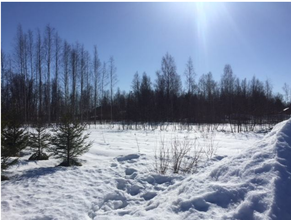
Bild 3. Gammal åkermark söder om kvarter 32.