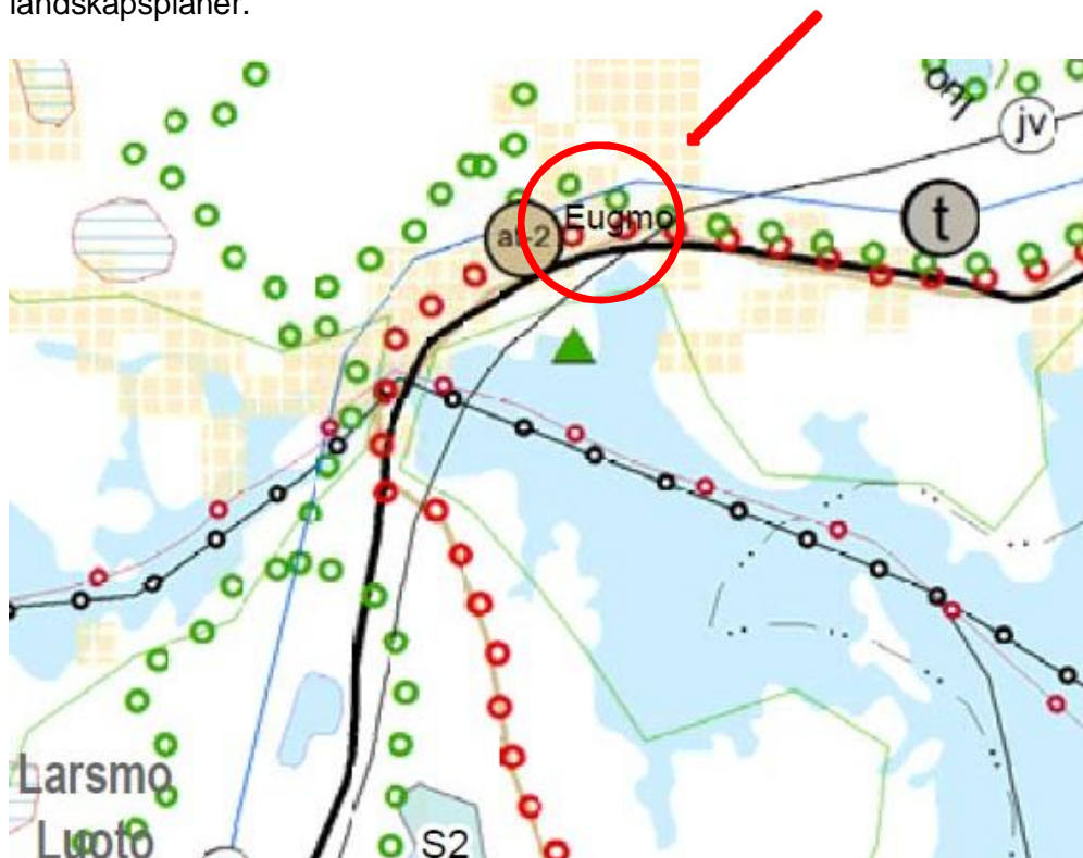
Bild 6. Del ur Österbottens landskapsplan 2030.

år 2019. Den nya landskapsplanen kommer att ersätta Österbottens landskapsplan 2030 och dess etapp-landskapsplaner.