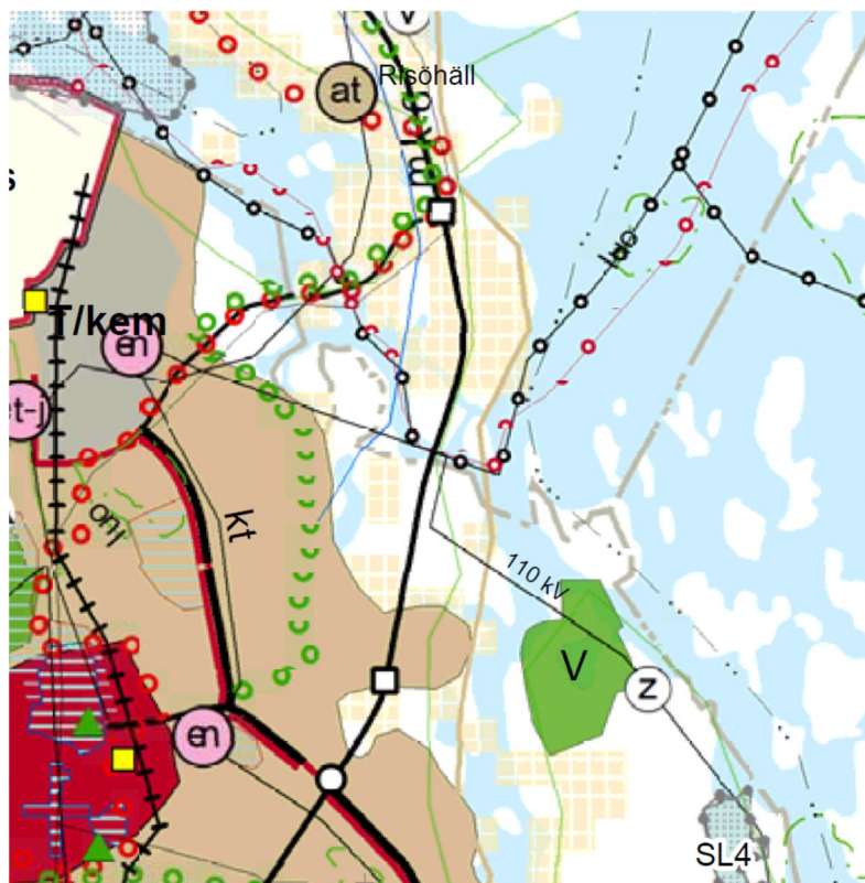
Bild 2. Del ur Österbottens landskapsplan 2030. Kuva 2. Ote Pohjanmaan maakuntakaavasta 2030.

På området finns ingen detaljplan eller generalplan. Området gränsar i söder till en befintlig detaljplan (Vikarholmen detaljplan).