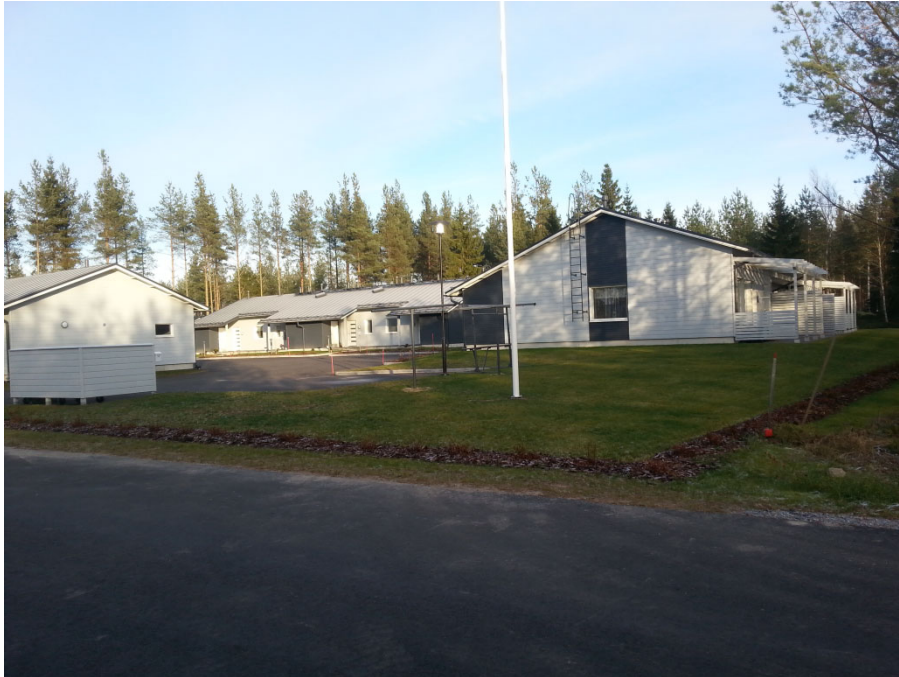
Päronvägen 1, Larsmo